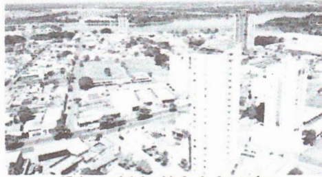
Vista parcial da cidade de Araguaína