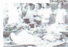
Alimentos serão destinados para alimentação escolar

A Secretaria Municipal da Educação de Araguaína (Semed) divulgou, no Diário Oficial do Município, a Chamada Pública nº 01/2024 para a aquisição de gêneros alimentícios diretamente dos agricultores familiares ou suas organizações. O programa tem como destino o abastecimento do Programa Nacional de Alimentação Escolar (PNAE) e o fortalecimento do vínculo entre a produção local e o fornecimento de alimentos para a alimentação escolar.