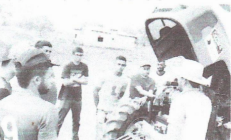
A qualificação profissional e oportunidades foram destaque entre as ações desenvolvidas

O programa Jovem Aprendiz; foi um dos projetos que ganharam notoriedade