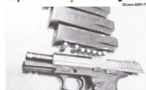
No momento da ação, outro indivíduo também acabou preso em flagrante