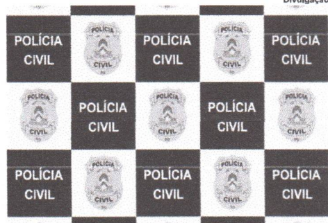
Operação teve como objetivo dar cumprimento a mandados de busca na cidade de Paraíso

No decorrer dos trabalhos investigativos, foi apurado que os indivíduos se utilizavam de métodos de dissuasão para convencer vítimas a encaminharem os "nudes", envolvendo até promessas em dinheiro que não eram cumpridas. Em outros casos, era realizada invasão do aparelho celular da vítima para obter as fotos.